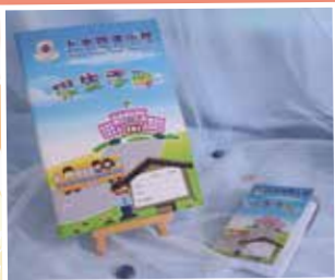
迷你學生手冊便條貼