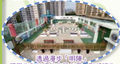
透過漫步「明陣」 讓學生和教師能安靜心靈，默想禱告 藉此反思生命的意義