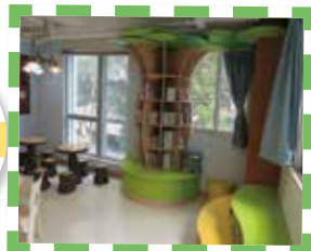
閱讀角仿照樹林環境設計