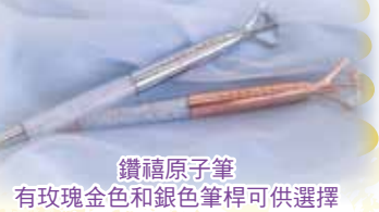
鑽禧原子筆 有玫瑰金色和銀色筆桿可供選擇