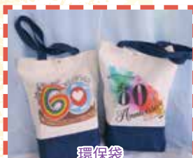
環保袋 左圖為校慶徽號設計亞軍作品 右圖為本校老師設計的作品