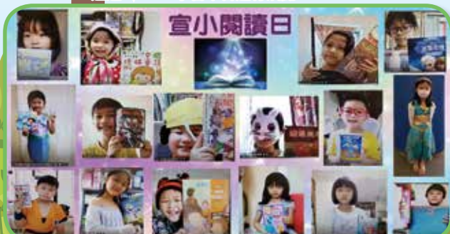
學生透過 TEAMS 學習平台一起分享圖書