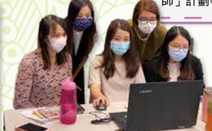
老師們一起就課程進行探討