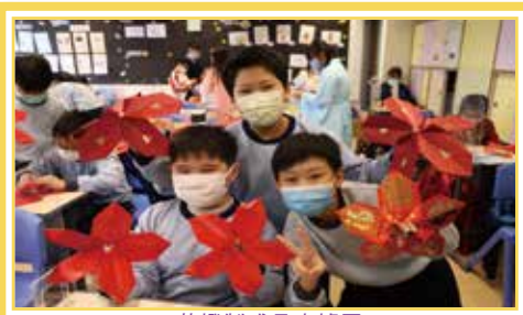
花燈製成品出爐了