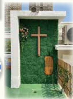
凝望懸掛的十字架， 讓我們回想耶穌基督為我們捨身的愛