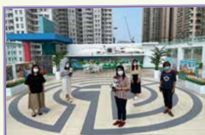
「心靈花園」建造小組為花園的誕生獻上感恩， 期盼大家在此與天父相遇