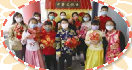
老師和學生一同穿起華服