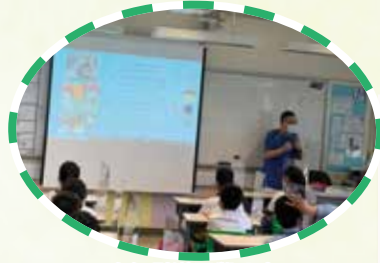
老師引導同學分享