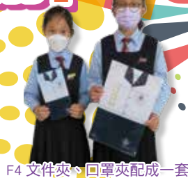
F4 文件夾、口罩夾配成一套