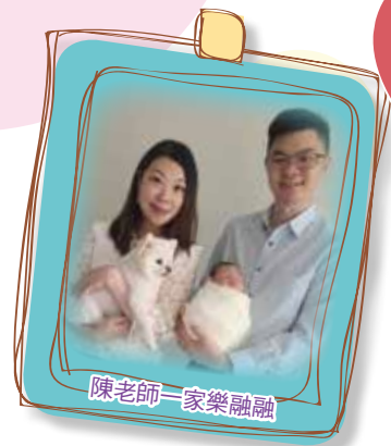
陳老師一家樂融融