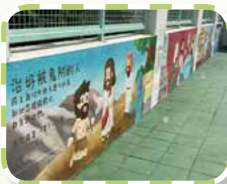
欣賞不同的壁畫， 認識耶穌的大能大力