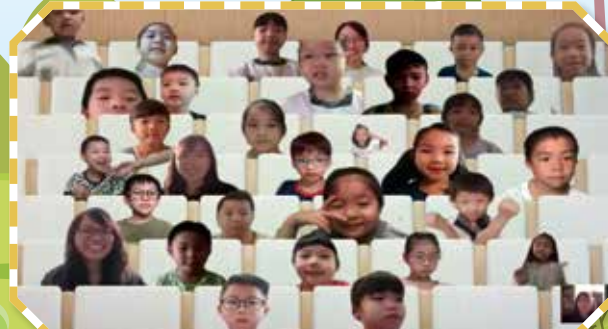
同學透過 TEAMS 學習平台與老師溝通