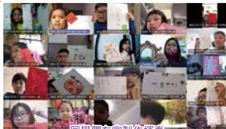
同學們在家製作揮春