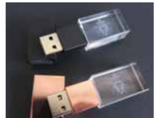
發光 USB，為徽號設計冠軍作品 分別有玫瑰金色和黑色可供選擇