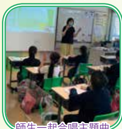
師生一起合唱主題曲 《生命有價》