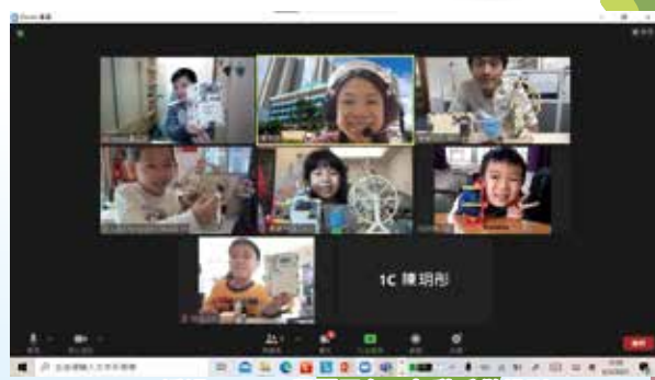
透過 TEAMS 學習平台一起動手做模型