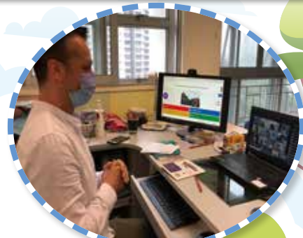
科技打破隔閡，疫情無阻學與教