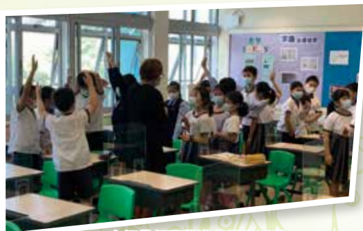
老師帶領同學進行課堂活動

生命教育計劃還設有相關的體驗活動、培訓小組及「我的生命教師」計劃等，將留待疫情穩定後陸續進行。