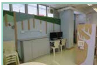
圖書館的牆身也經過特別設計