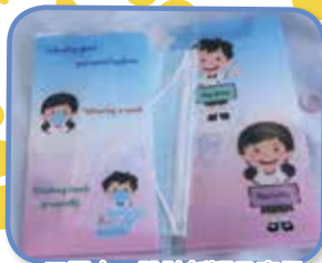
口罩夾，設計新穎又實用