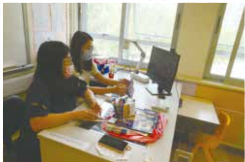
教師不斷嘗試 TEAMS 的功能