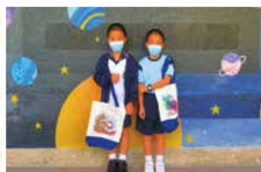
為免向隅，欲購從速！