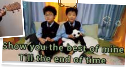
Show you the best of mine Till the end of time