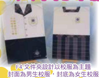
F4 文件夾設計以校服為主題 封面為男生校服，封底為女生校服