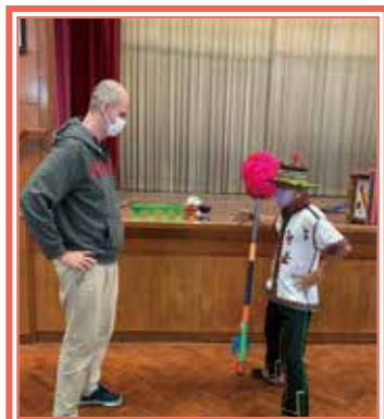
老師跟師傅一起學習雜技表演