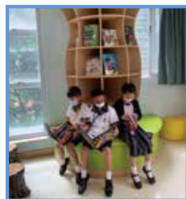
同學體驗開卷有益的樂趣