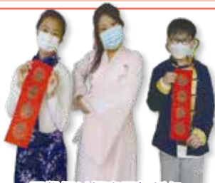
同學們以揮春同賀新年