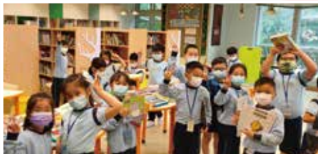
同學興奮地到圖書館借閱圖書