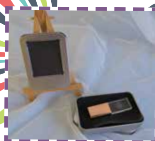
容量 16G，內存學生表演精華片段