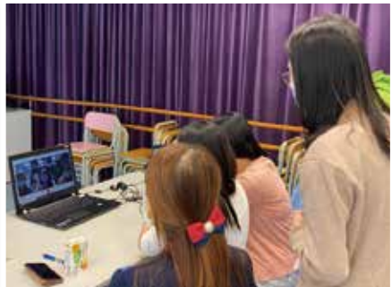
教師一起為 TEAMS 教學作準備