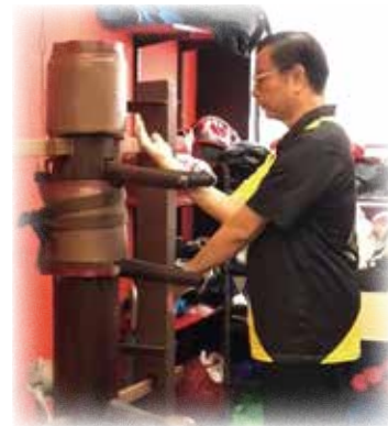
詠春師傅示範打木樁