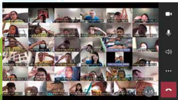
透過 TEAMS 學習平台進行活動