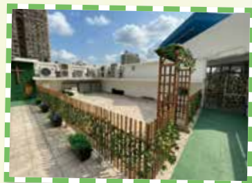
「生命園圃」種植不同的農作物， 讓學生體會生命成長的過程 學習更加珍惜生命