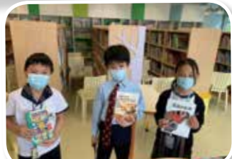
同學向其他小讀者推介圖書