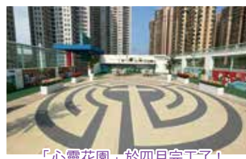
「心靈花園」於四月完工了！ 願同學在這花園 默想和思考天父的話語，親近天父

為了營造校園的正向氛圍，本校今年已重新規劃全校生命教育的設置，包括「心靈花園」及「為生命加分」表揚榜。「心靈花園」設於五樓，內裏分為三個區域，包括：10幅以「耶穌行神蹟」為主題的壁畫、「明陣」及「生命園圃」。同學們可跟隨聖經課教師到「心靈花園」欣賞壁畫，教師可透過壁畫，與學生分享耶穌行神跡的大能，以豐富學生對聖經的認識，以及建立正面的人生觀；在「心靈花園」內還設有「明陣」，旁邊提供「使用明陣指引」，讓教師和學生可藉著漫步於「明陣」中，安靜心靈、思考人生及向天父祈禱；「心靈花園」入口的右邊，則是「生命園圃」，供「生命園丁」小組組員及「宣小農夫」種植，期盼透過種植活動，讓學生體會生命成長的周期，從而更加珍惜生命；學校地下則設有「為生命加分」表揚榜，以表揚學生在學術、體藝以及品德方面值得讚揚的地方，讓我們在各領域上盡力發揮自己，相信天父必展開笑顏，為我們的努力而鼓掌。