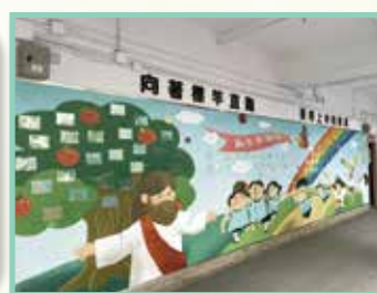
「為生命加分」表揚榜， 表揚學生在不同方面的優秀表現