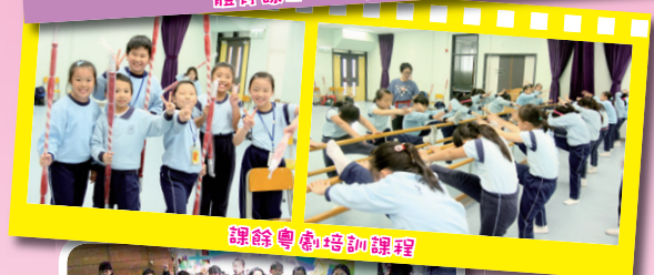
課餘粵劇培訓課程