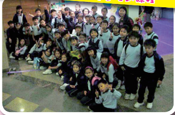
觀賞香港舞蹈團的《粵港澳兒童舞蹈匯演》