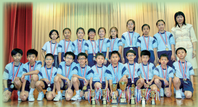
全港小學跳繩比賽