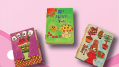
6A 黃紫樞、鄭穎心、 黃文玉(我最喜愛的圖書)