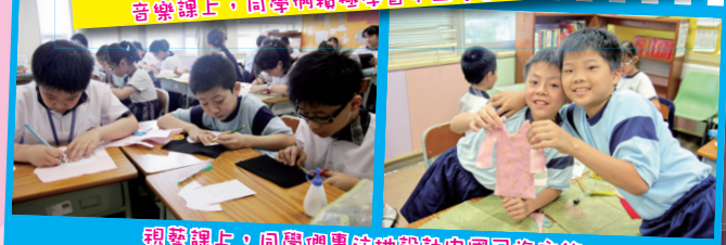
視覺課上，同學們專注地設計中國民族服飾