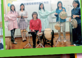
參加香港青苗粵劇團的導賞活動