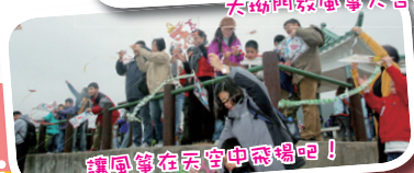
讓風箏在天空中飛揚吧！