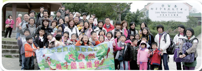
獅子會自然教育中心大合照