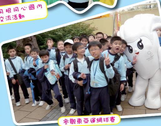
參觀東亞運網球賽