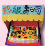
4B 李浩民、孫朗日、 文得殷、溫峻仁、 魏子俊(小食店)