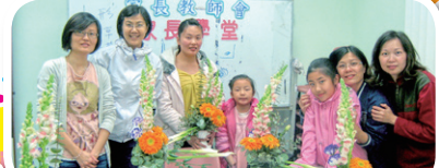
我們的作品是多麼美麗啊！