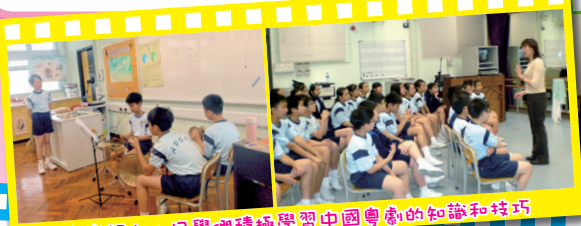
音樂課上，同學們積極學習中國粵劇的知識和技巧

同時，為更有效推廣中國藝術，本校參與了康樂及文化事務署及劍心粵劇團合辦的粵劇培訓試驗計劃，讓同學透過「粵劇互動劇場及粵劇折子戲導賞」工作坊接觸和認識粵劇的表演元素，進深認識中國文化，並挑選具潛質的學生參加的課餘粵劇培訓，以對有興趣學藝或觀賞粵劇的學生提供更全面的培育。