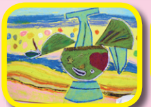
4B 李諾潼、曾凱琳 (立體主義拼貼畫)