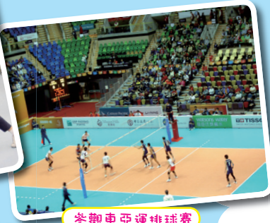
參觀東亞運排球賽