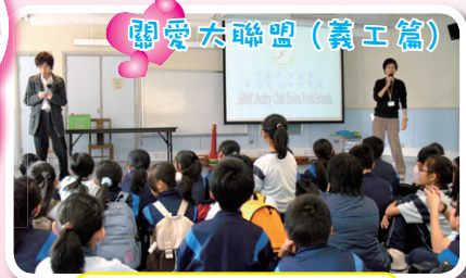
大家來一起認識學校的特色！