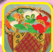
6B 馬雋昕、 梁文輝(立體 主義拼貼畫)