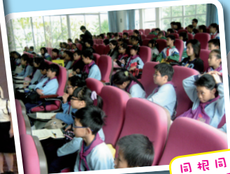
同根同心國內交流活動