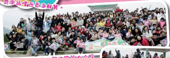
大姑門放風箏大合照