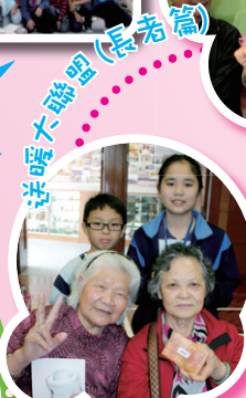
送暖大聯盟 (長者篇)

為培養學生的共通能力、價值觀和態度，豐富學生切身體驗的學習，從而達致全人發展，常識科於本學年配合「全方位學習」，推行各級校本服務學習課程，透過運用不同的學習策略，如遊戲、合作學習及戲劇教學等，並透過一連串學習活動，如進行清潔、表演、設計遊戲、製作小禮物等，讓學生清楚了解服務學習計劃的安排；了解義務工作的概念及精神；掌握做義工應具備的態度及條件。於各項活動中，同學們均展現出無限的愛心，樂於助人的精神。