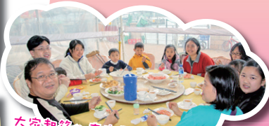
大家聚餐，齊來品嚐西貢海鮮餐。