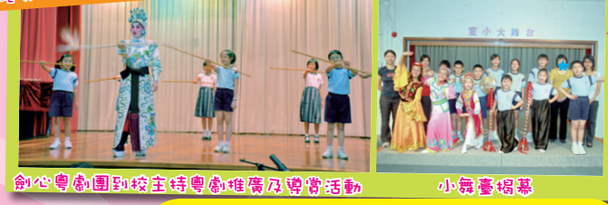
劍心粵劇團到校主持粵劇推廣及導賞活動