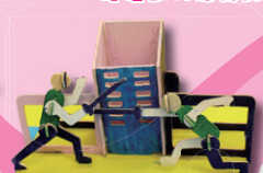
6B 馮靖藍 (運動文具座)