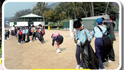
讀我美麗的蝴蝶灣！