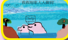
5B 許灝(愛護瀕臨 絕種動物海報設計)