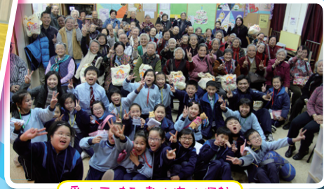
愛心天使到老人中心探訪