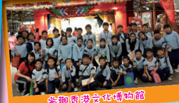
參觀香港文化博物館