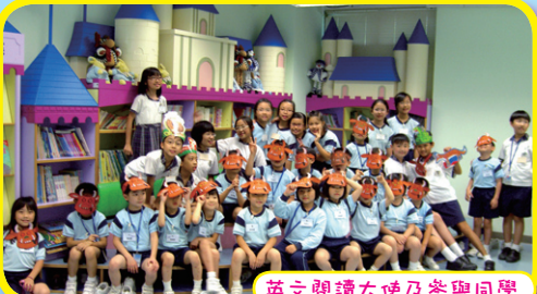
英文閱讀大使及參與同學