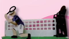
6A 黃紫樞 (運動文具座)