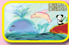
5B 賈嘉穎(愛護瀕臨 絕種動物海報設計)