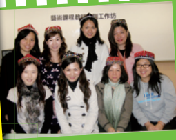
藝術課程教師培訓工作坊