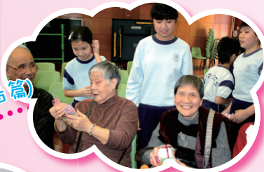
老幼是一家，不分你我他！