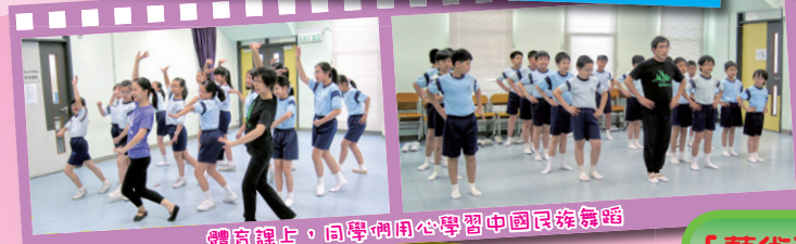
體育課上，同學們用心學習中國民族舞蹈