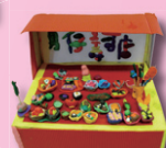
4C 張嘉希、 林浩君、朱俊楷、 劉惜晴、侯峻然、 吳岳瑋(小食店)