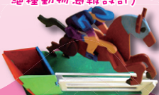
6A 莫曉琳 (運動文具座)