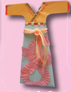
4C 林逸晴 (漢服設計)