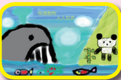
5A 文子康(愛護瀕臨 絕種動物海報設計)