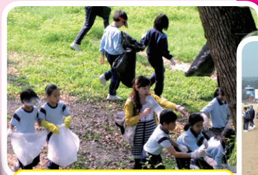
大家同心協力，做到最好！Yeah!