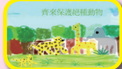
5A 侯凱倫(愛護瀕臨 絕種動物海報設計)