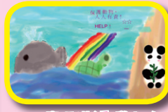
5B 廖仰淇(愛護瀕臨 絕種動物海報設計)