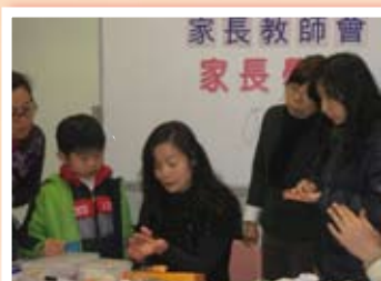
看！我們是多麼留心呢！