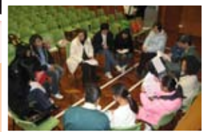
父母和孩子一起反思，共同建立有效的溝通模式。