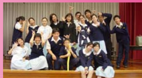
北區跨校閱讀大使