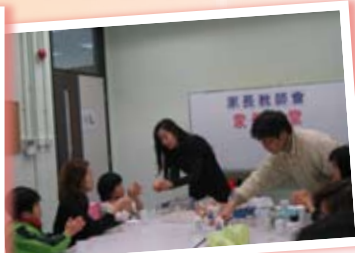
楊太正在個別指導學員如何製作五代同堂的果子。