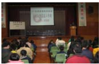
大朋友和小朋友一齊來學習管理情緒。