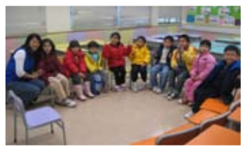
兒童組活動快要開始了，Are you ready?