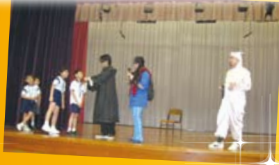
德育及公民教育劇場