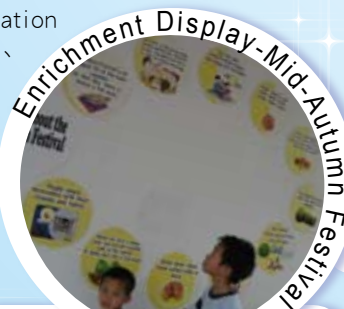
Enrichment Display-Mid-Autumn Festival