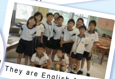
They are English Angels