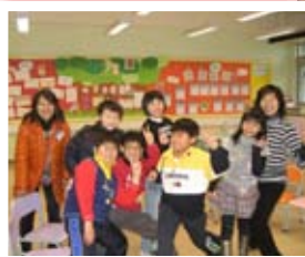
我們學到很多情緒管理的方法，yeah!