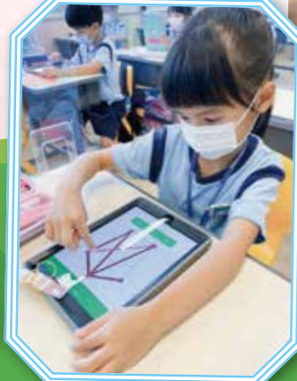
用Ipad進行一筆畫活動