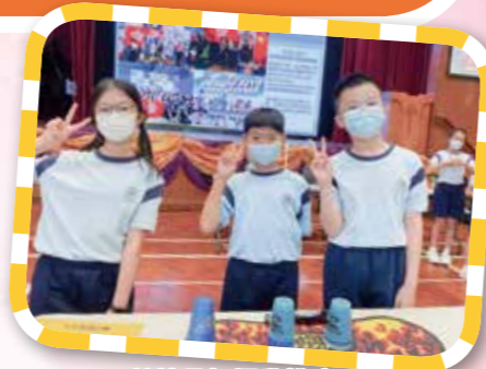
競技壘杯運動推廣