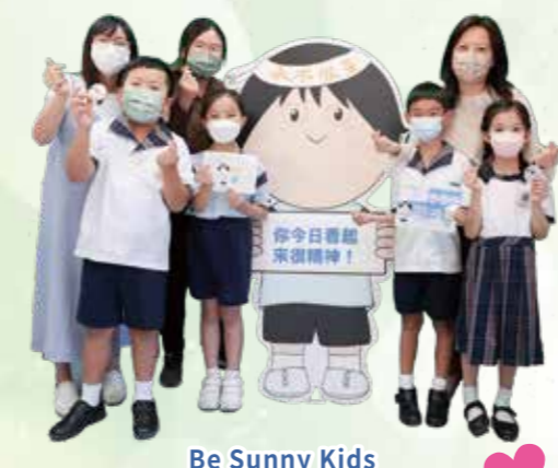
Be Sunny Kids

學校是學生重要的社交場所，我們重視師生及同學之間的溝通及連繫。希望學生學習不同的社交技巧，建立彼此間的情誼。但受新型冠狀病毒疫情的影響，大家不得不保持距離，減少社交接觸。人與人之間的關係，難免比以往疏離，相處上也更易引起磨擦。