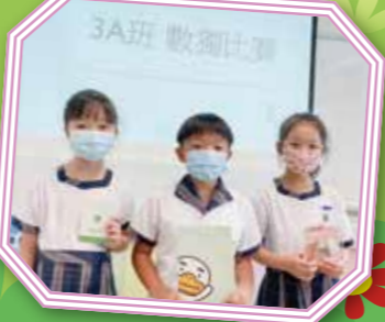
班際數獨比賽獲獎同學