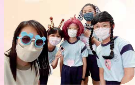
用心準備「同理心劇場」