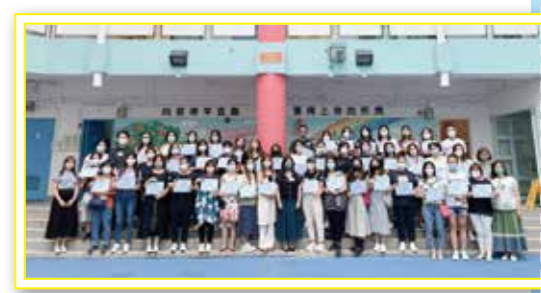
家長義工熱心參與服務

表現同理心的最佳榜樣，莫過於主耶穌。祂是神，但卻成為人的樣式，體驗人一切的經歷和感受。讓我們都以基督耶穌的心為心，在家庭、學校或不同的群體，學習與他人分享喜悅與憂傷，與人結伴同行。