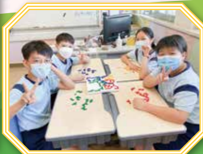
在Blokus遊戲中，學生樂在其中，並應用空間思維、邏輯推理的能力