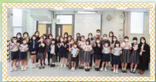
「我的生命教師」啟動禮