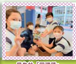
學生於「同理種」活動中完成移苗