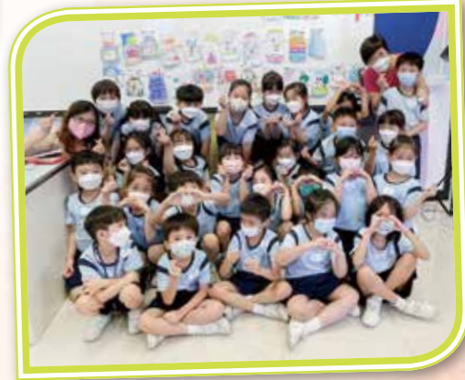
藝術創作體驗——神奇的樽