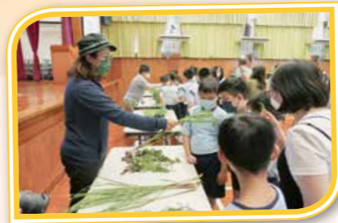
認識不同植物的特色