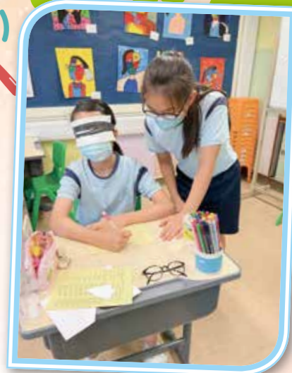
矇眼體驗瞎眼人士的感受

學校在上學年舉辦了一連兩天的生命教育體驗日，學生按級別參與以下三個主題的活動，包括「生命的主人」、「愛鄰舍」及「永續家園」。透過不同的體驗活動，學生學習了解及欣賞自己，同時建立同理心，了解他人的需要，並延伸至欣賞及愛護大自然，學會尊重不同的生命。