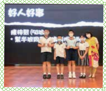
高小周會表揚「好人好事」

為使同學養成運用正向言語的習慣，學校以上年度的「一句好話」活動為基礎，推出「每周好話」，希望學生坐言起行，用言語關心身邊的人。期望學生成為「Sunny Kids」的一份子，並與「Sunny Bear」一同成長，關心彼此。