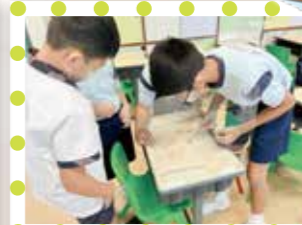
竹籤遊戲緊張又刺激