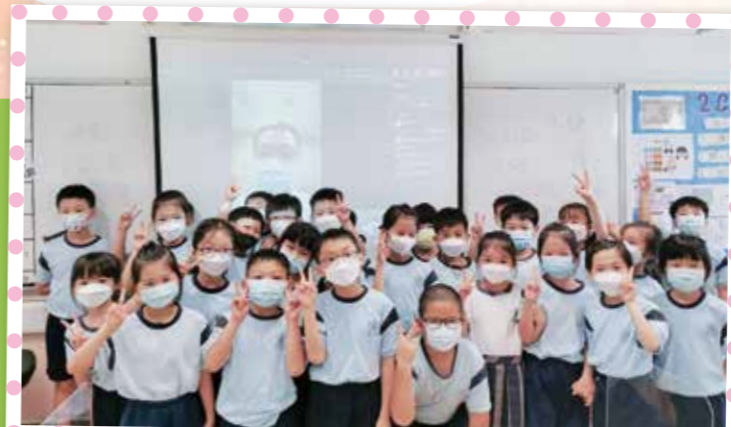
訪問不同職業人士，了解當中的苦與樂