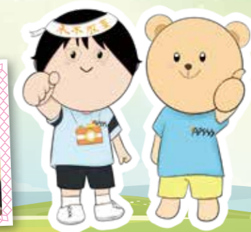
Sunny kids和Sunny Bear 陪伴學生成長