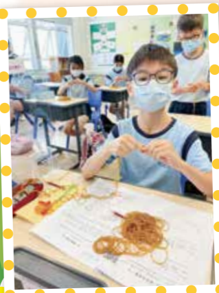
自製懷舊玩具——橡皮筋繩