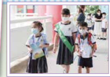
風紀帶領小一學生到教室