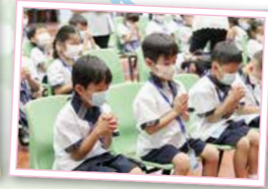
在開學禮中，學生同心禱告