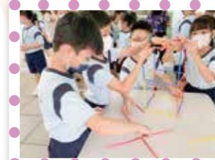
學生體驗建築師的工作，興建「建築物」

學校於八月份舉辦了專題學習日。初小學生透過人物專訪及職業體驗活動，認識社會上各行各業的苦與樂；高小學生則探討昔日玩具的特色和意義，以及認識玩具的發展和演變，藉此反思個人的生活態度，學習感恩惜福。