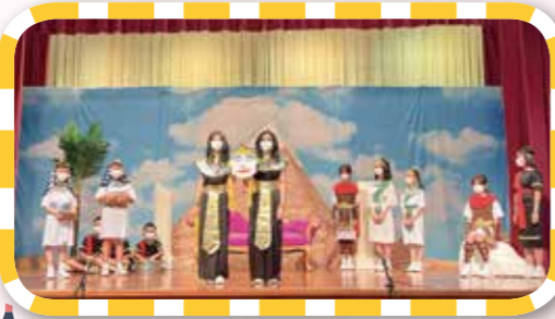
英語劇團年終演出