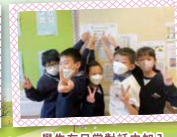
學生在日常對話中加入「每周好話」