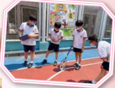
在數學遊戲活動中，同學們同心協力在校園中挑戰不同的任務