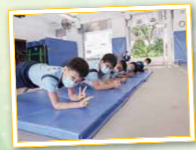
學生積極參與體育周，鍛鍊身體