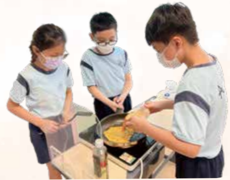
用親手種的蔥炒蛋，學會欣賞及珍惜食物