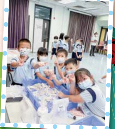
小一學生化身麵包師傅搓麵糰