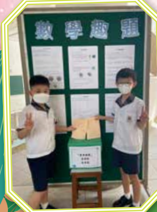
學生踴躍參與數學趣題大挑戰