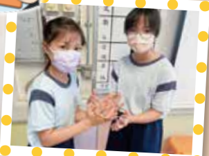
玩花繩——考你手眼協調