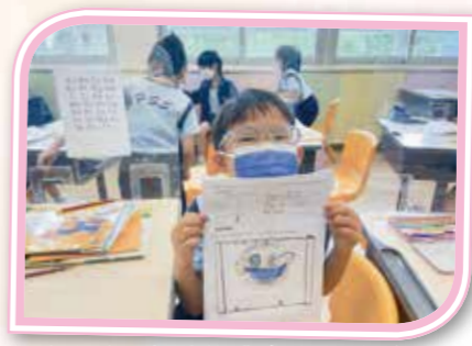
透過多元智能的體驗活動了解自己