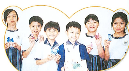
公開組冠軍——數學戰棋