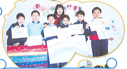
本校亦頒發獎狀予表現優異的同學