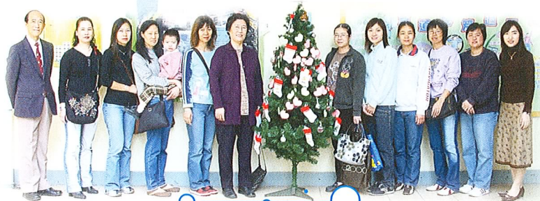
保健區家長義工隊