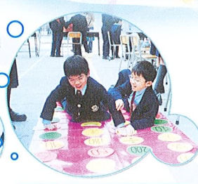
大家齊來玩玩，多刺激！