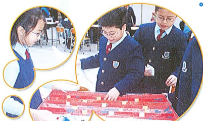
同學的心血也曾在本校家長日展出