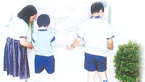
大家齊來量一量吧！