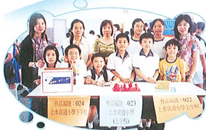
同學的作品在校外亦獲佳績