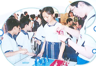
我們更向校外的同學介紹得獎的傑作