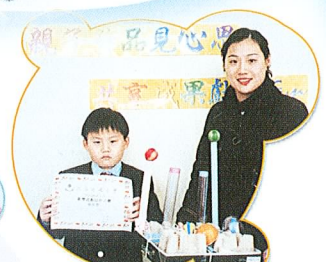
親子製作，別具意義