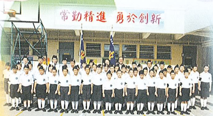
142 及 143 分隊大合照