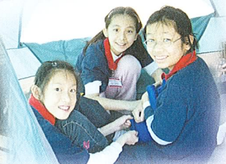
大家分工合作，收拾細軟