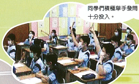
同學們積極舉手發問，十分投入。

進行教學研究是教師專業發展重要的一環，因此本校去年參與了香港教育學院的創展協進計劃。本校數學小組舉行了多次會議，用以探討課題、擬定教案、課堂實踐及教學檢討。整個研究由專業發展顧問老師帶領，並有學院導師作出指導。在十月間被邀請到教育學院分享研究成果。研究課是以《變易理論》為依據，有效地促進教師們協作，加強了對教學內容的掌握，加深了對學生不同表現的理解，對不同教學法的運用進行交流，使學與教的果效顯著提昇，對學生的學習很有幫助。