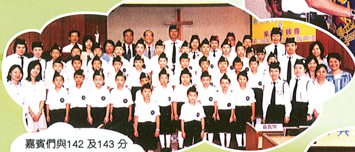
嘉賓們與142及143分隊導師、隊員大合照