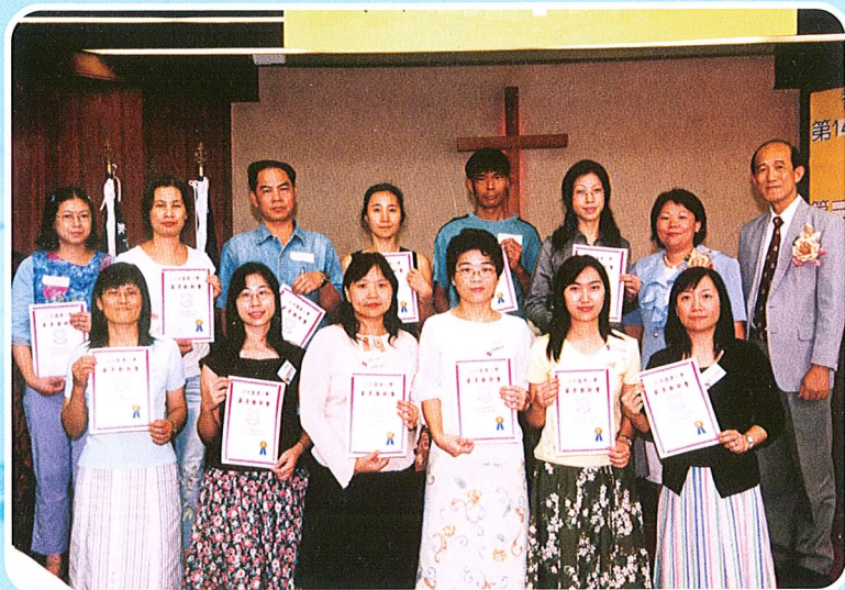
家長教師會第二屆常務委員會