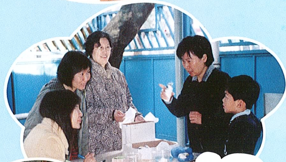
家長義工協助防疫工作