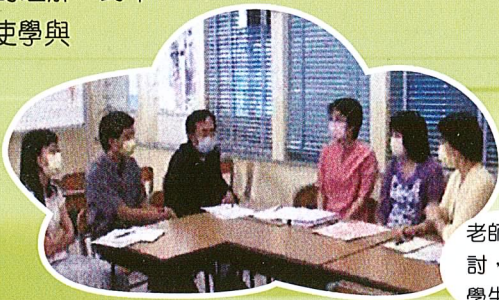
老師們一起備課、討論和檢討，以提昇教學質素，幫助學生的學習。