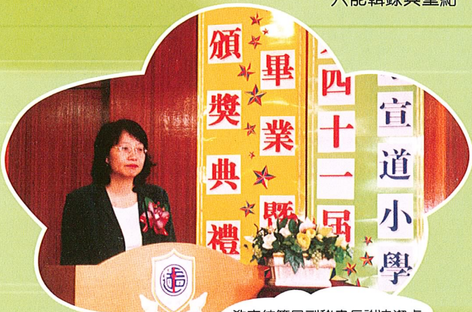
教育統籌局副秘書長謝凌潔貞太平紳士為本校致詞