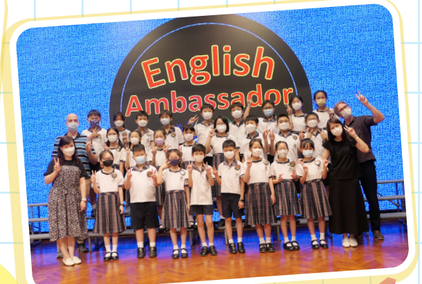
English ambassadors are waiting for you!