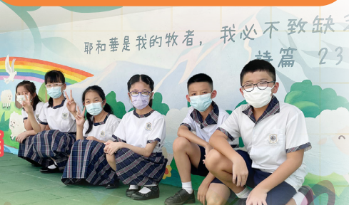
耶和華是我的牧者，我必不致缺乏 詩篇 23