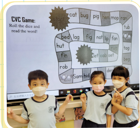
Learning phonics through fun games