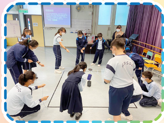
「社職員培訓班」提昇學生的領導才能及責任感，有助推動社際活動

我們相信每一位學生都有不同的天賦，藉多元化的課後活動及培訓，能啟發他們的潛能。本校每年舉辦才藝表演，將學習成果與同學分享，藉此建立自信心。此外，本校把全校學生分為四社，由高年級學生擔任社長及社職員，帶領同學們參與社際活動，以培養他們的領導才能。社際活動能團結不同班級的學生，推動自律和合作精神，亦能增強學生對學校的歸屬感。