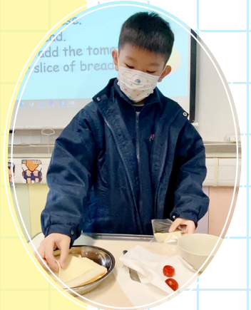
Post-reading activity - Cooking Channel