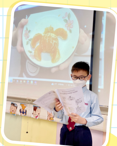
Show and tell