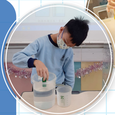
六年級動手操作活動： 排水法