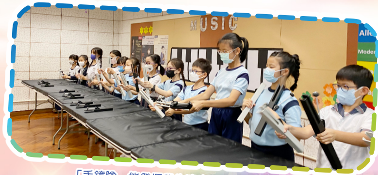
「手鐘隊」能發揮學生演奏潛能及團隊精神