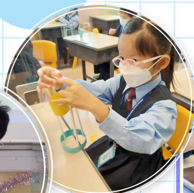
一年級探究活動： 管飛行器