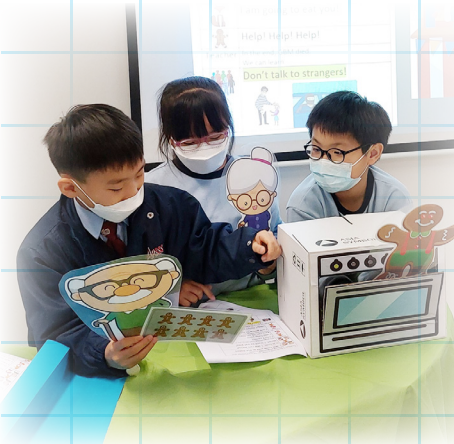
Reading Workshop activity - Puppet Show