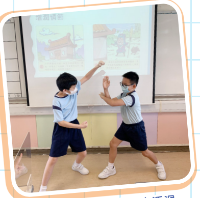
小四學生在圖書教學中透過話劇演繹人物角色