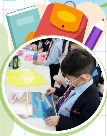
同學們投入閱讀攤位的遊戲