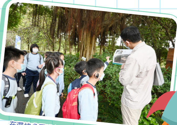
在濕地公園進行戶外學習了解濕地的動植物