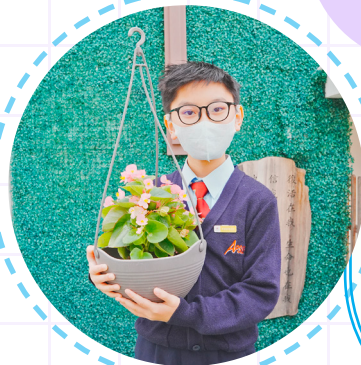
「一人一花」種植活動 花兒健康生長