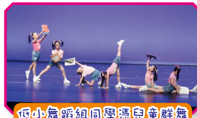
低小舞蹈組同學憑兒童群舞「愛閱」獲甲等獎

學生積極參與校外比賽，如香港學校舞蹈節、香港學校音樂節、香港學校朗誦節等，成績卓越，並藉着切磋交流，開闊視野。