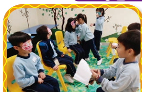
「逆境小勇士」透過遊戲， 學習堅毅地面對困難的態度