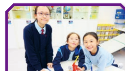
「宣小機關王」 的任務富挑戰性