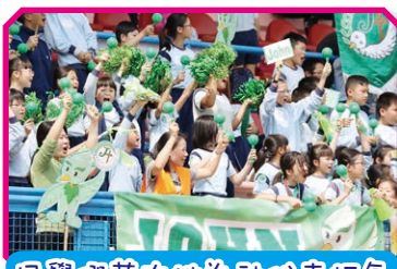
同學們落力為社代表打氣