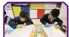
「藝術尖子培訓班」 發展學生的藝術潛能