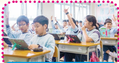
引入電子學習，促進課堂互動