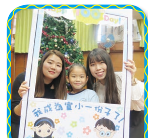
藉小一感恩會建立家校合作的緊密關係