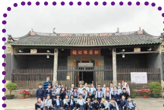
學生到圍村參觀，並認識圍村文化