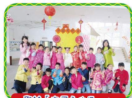
舉辦「中國文化日」，讓學生學習欣賞中國文化