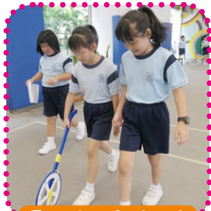
學生合力完成任務