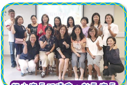
設立家長祈禱會，鼓勵家長同心禱告，為學校守靈