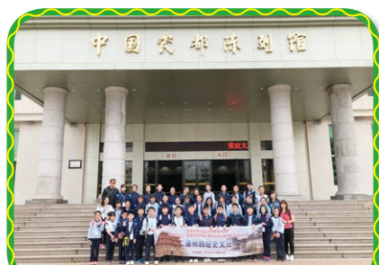
參與「同根同心內地交流計劃」，加深學生對國家發展的認識