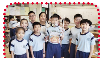
小五學生在圖書教學中透過話劇演繹人物角色