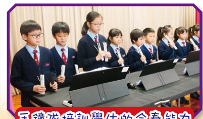
手鐘隊培訓學生的合奏能力