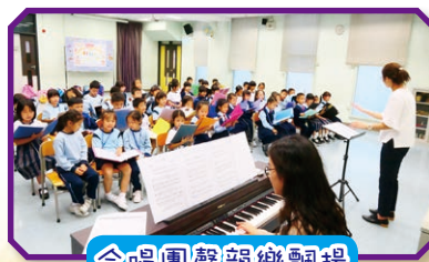
合唱團聲韻樂飄揚