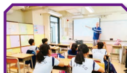
「Elite English」 提昇學生的英語會話能力

我們相信每一位學生都有不同的天賦潛能。除了在課堂內加入「創意四心五力」的訓練外，還於課後舉辦抽離式培訓小組，發展學生的才華。課後培訓班以提昇創意為重點，實踐資優教育理念，使高能力學生得以發揮潛能。