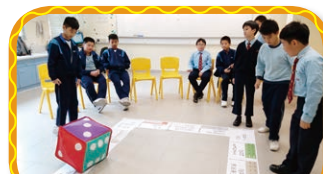
「網絡社交達人」透過活動， 學習網絡交友的技巧

每年均會舉辦不同的課後輔助小組，如：「醒目兒及快樂兒獎勵計劃」、「正能量大使培訓」、「網絡社交達人」、「戲·友·益」、「逆境小勇士」、「成長的天空」等，培養學生樂觀感、提昇自信心、社交技巧及發揮潛能。