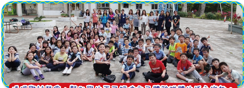
透過舉辦營會，幫助學生更了解信仰及體驗群體生活之樂趣。