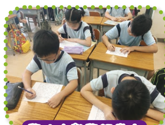
學生在數學課堂中學習解難技巧