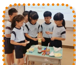
Learning English through interactive activities