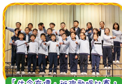
「生命有價」班際歌唱比賽， 學生出盡渾身解數，演繹歌曲