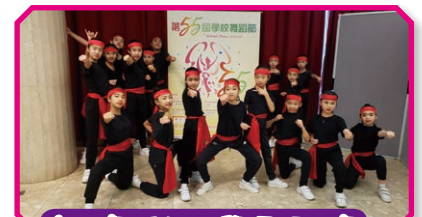
高小舞蹈組同學憑現代舞「苦·練」獲甲等獎