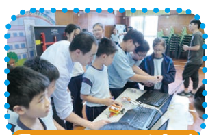
學生以小組形式完成STEM專題研習