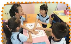
Learning phonics through games