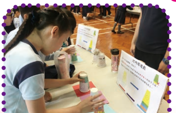
數學遊戲培訓學生的思維能力