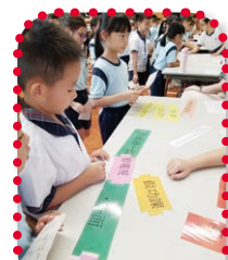
小一及小三學生透過喜樂課堂外的活動學習中文