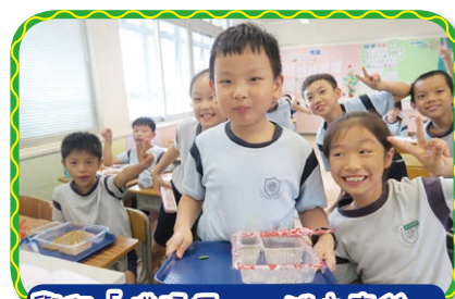
舉行「惜福周」，減少廢餘，培養學生珍惜食物的態度。