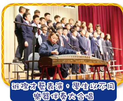
班際才藝表演，學生以不同 樂器伴奏大合唱