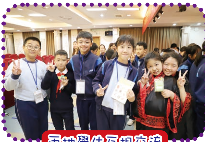
兩地學生互相交流