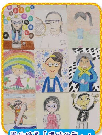
學生繪畫「獨特的我」， 尊重自己獨特的外貌