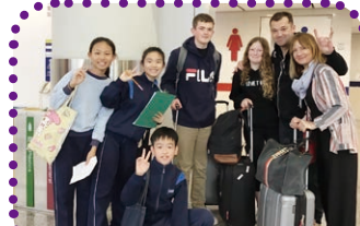
Interviewing tourists at the airport