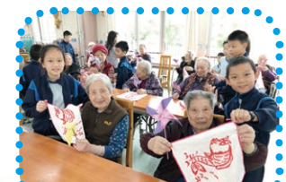
學生到老人院進行服務學習