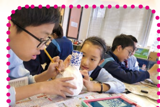
學生運用平板電腦創作視藝作品