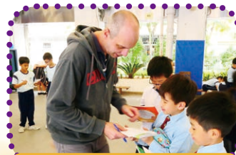
Learning English on English Challenge Day