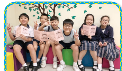
透過宗教活動，如宗教周、讀經馬拉松等，加深對聖經的認識