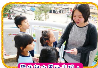
學生努力爭取表現， 成為禮貌之星