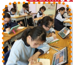
P6 reading workshop