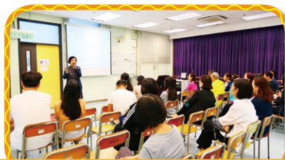
舉辦「6A品格——愛與管教的平衡 法則」家長講座，讓家長發掘孩子的 獨特性，懂得欣賞及接納自己的孩子