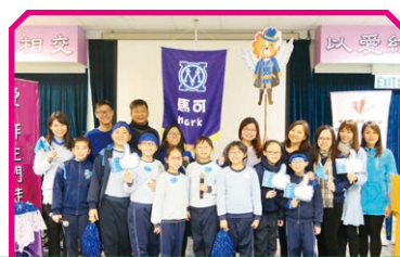
社監和社職員一起主持社員大會

學校推行社際活動及比賽，學生在社際運動會、社際投籃比賽及社際打字比賽等活動中的表現，充分發揮各年級之間互助友愛、團結合群的精神，顯示同學對學校及所屬的社的歸屬感。各社學生均積極參與社員大會，社職員帶領同學打氣、分工，有效發揮領導和組織能力。