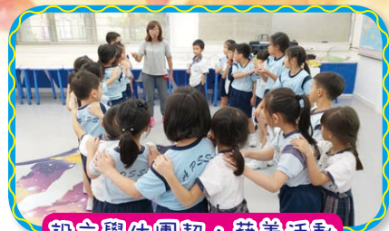
設立學生團契，藉着活動及遊戲認識信仰

學校每年會訂立宗教主題，並藉着多元化的宗教活動，讓學生認識聖經真理，並學習信靠神。