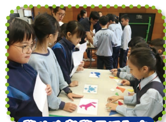
學生在數學同活動中運用解難知識