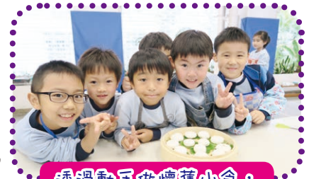
透過動手做懷舊小食，學會欣賞及珍惜舊墟文化