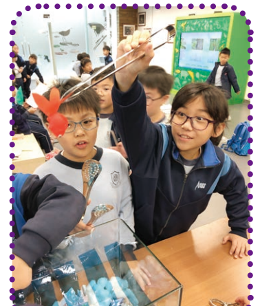
三年級學生透過活動認識海洋污染