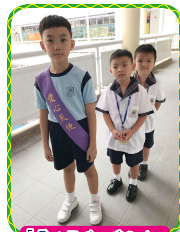
「愛心天使」協助小一新生適應校園生活