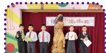
學生在「語文演。講。聽」以短劇介紹圖書，表現自信