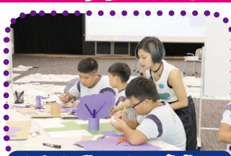
六年級學生出外參觀，並創作藝術作品