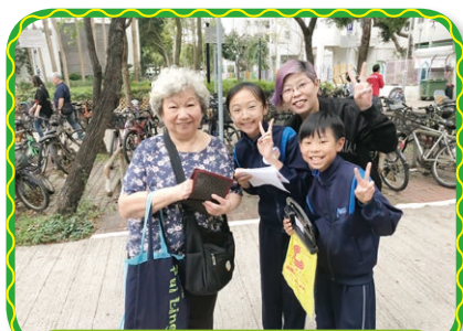
舉行「親子賣旗」，家長與學生身體力行，服務社區

德育及公民教育是全人教育的重要元素，學校透過多元化的活動，提昇學生對祖國的歸屬感，同時培養他們成為有見識、富責任感及有誠信的公民，為全人類的福祉作出承擔。