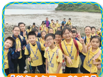
「基督少年軍」培訓隊員成為基督的精兵