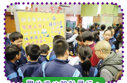
學生用心設計展板，向家長匯報學習成果