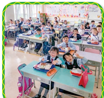
午餐時段關燈，響應「地球一小時」