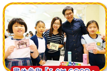
學生參與「I AM GOOD」 加油站，感謝父母深恩