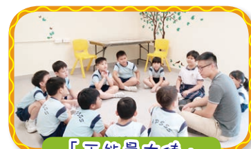
「正能量大使」 培養學生的樂觀感