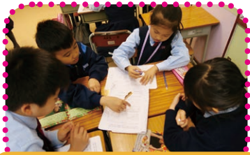
學生於小組中合作解決困難