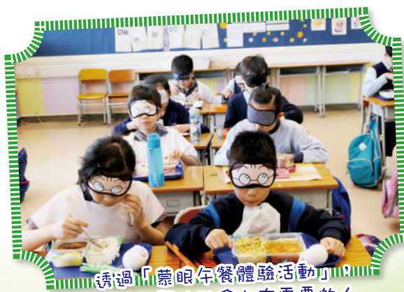
透過「蒙眼午餐體驗活動」 認識及關注社會上有需要的人