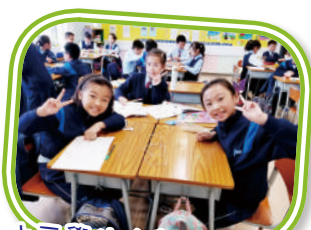
小五學生在數學課堂中學習解難技巧