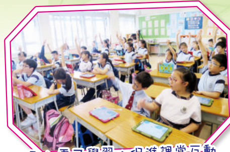
引入電子學習，促進課堂互動