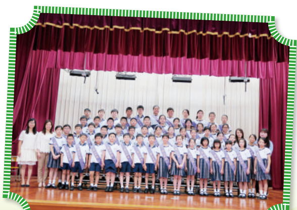
設立「愛心天使」義工隊， 實踐關愛世人的精神

德育及公民教育是全人教育的重要元素，學校透過多元化的活動，提昇學生對祖國的歸屬感，同時培養他們成為有見識、富責任感及有誠信的公民，為全人類的福祉作出承擔。