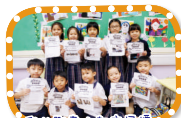
我的戰書：訂立目標， 與家人一同接受挑戰