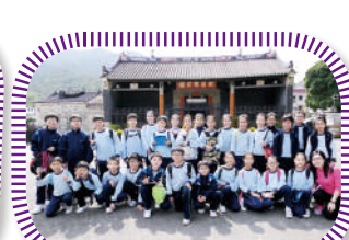
五年級同學參觀 龍躍頭文物徑