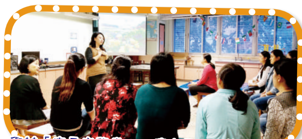
舉辦「家長樂學堂」，讓家長認識管教與情緒 的關係，以建立和諧的親子關係

學校透過舉辦家長講座、工作坊，讓家長分享孩子的成長需要和管教心得，同時幫助家長有效地培育子女的成長。