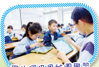
學生運用思維圖學習多角度思考