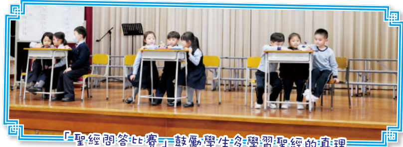
「聖經問答比賽」鼓勵學生多學習聖經的真理