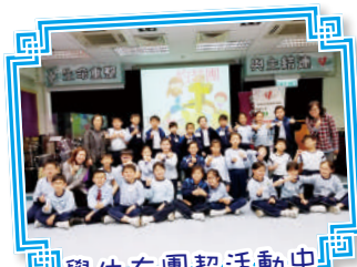
學生在團契活動中 建立屬靈的生活