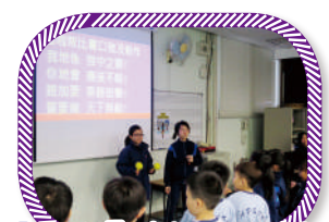
「社職員培訓班」培訓 學生的領導能力