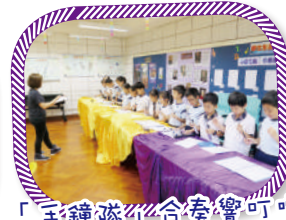
「手鐘隊」合奏響叮噠