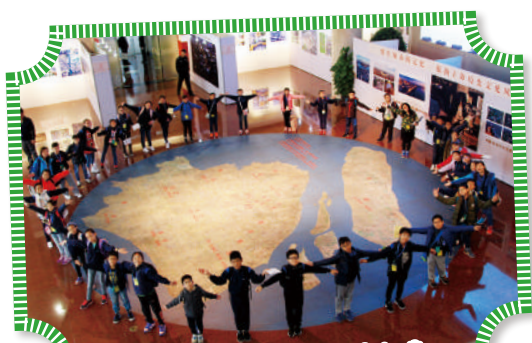
參與「同根同心內地交流計劃」 加深學生對國家歷史及科技發展的認識