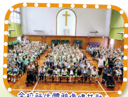
全校師生體驗傷健共融， 培養關愛精神