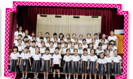
聯校音樂大賽小學合唱團全獎