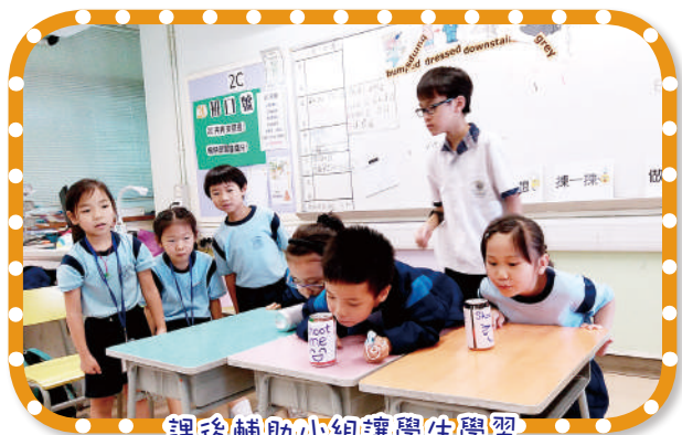
課後輔助小組讓學生學習 以勇敢堅毅的態度面對挑戰

每年均會舉辦不同的課後輔助小組，如：「醒目兒及快樂兒獎勵計劃」、「風紀領袖培訓」、「社交達人」、「戲·友·益」、「正能量大使」、「逆境小勇士」及「逆風小子」等，讓學生從中學習社交及情緒管理技巧，提昇正能量。