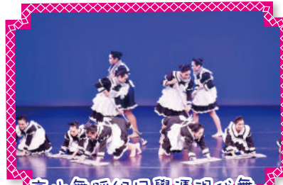
高小舞蹈組同學憑現代舞 「清潔進行中」獲甲等獎

學生積極參與校外比賽，如香港學校舞蹈節、香港學校音樂節、香港學校朗誦節等，成績卓越，並藉着切磋交流，開闊視野。