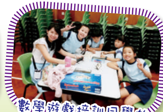
數學遊戲培訓同學的 思維能力