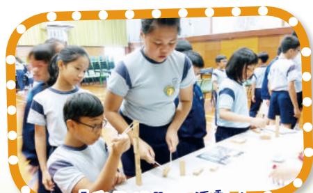
「我敢挑戰」活動： 「筷」高長大層層疊