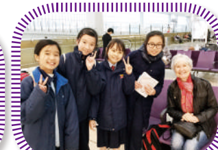
Interviewing tourists at the airport