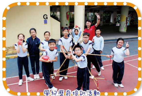
風紀歷奇培訓活動 幫助學生建立團體精神