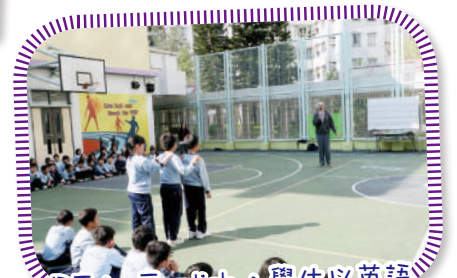
PE in English，學生以英語 進行體育活動，完成挑戰任務