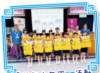
「基督少年軍」活動 讓隊員成為基督的精兵