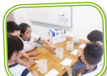
學生在數學周活動中運用解難知識