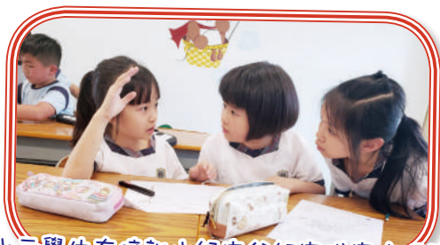
小三學生在培訓小組中分組完成寫作任務