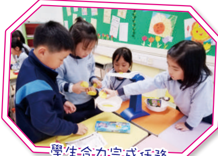
學生合力完成任務