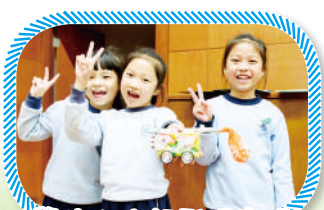
學生以小組形式完成STEM專題研習