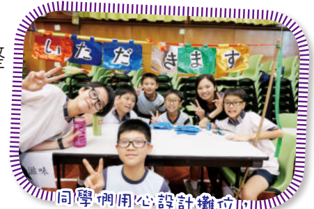
同學們用心設計攤位 匯報學習成果