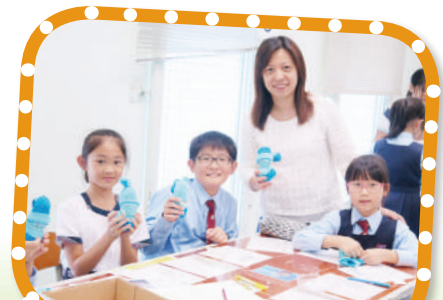
「讓愛傳出去」活動：學生製作 「襪襪送手作仔」送贈區內長者