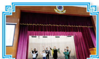
復活節崇拜中的話劇表演 讓學生認識復活節的意義