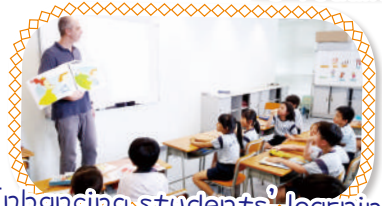
Enhancing students' learning with Big Book approach