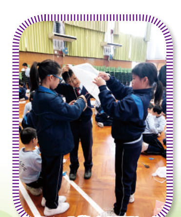
四年級同學在STEM Day 製作「雞蛋降落傘」