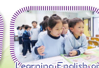
Learning English on English Challenge Day