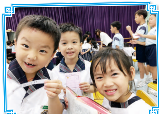
學生在「宗教雙周」活動中學習神的話語