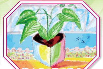
學生運用平板電腦 創作視藝作品