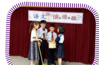
同學在宣小舞台演出短劇， 表現投入、自信