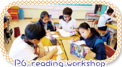
P6 reading workshop