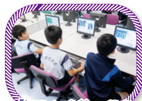
「紅小精英」設計 電腦遊戲

我們相信每一位學生都有不同的天賦潛能。除了在課堂內加入「創意四心五力」的訓練外，還於課後舉辦抽離式培訓小組，發展學生的才華。課後培訓班以提昇創意為重點，實踐資優教育理念，使高能力學生得以發揮潛能。