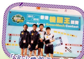
「宣小機關狂」朝着 「香港機關王」的夢想進發