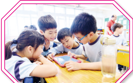
學生於小組中合作解決困難