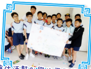
營會生活幫助學生更了解信仰， 享受群體生活的樂趣