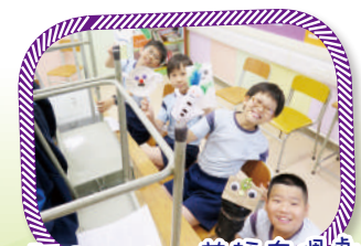
「eSpeak」英語布偶劇 幕後花絮