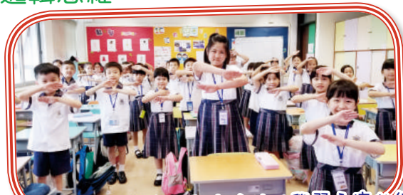
小一學生在喜閱課堂活動中愉快地學習文字的結構