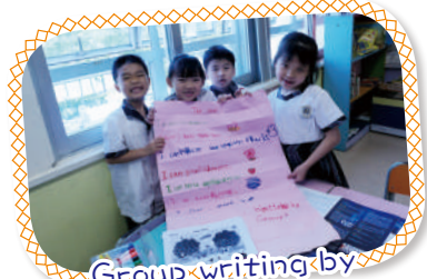
Group writing by Primary One students