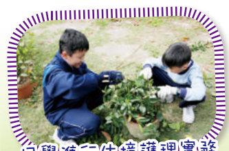
同學進行生境護理實務