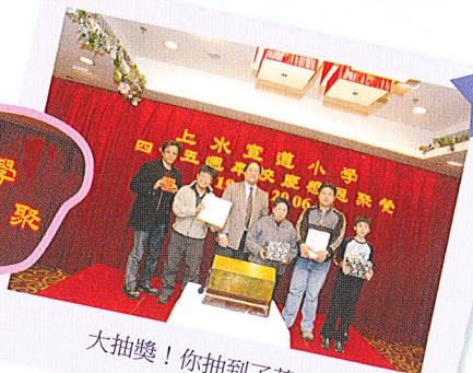
大抽獎!你抽到了甚麼?