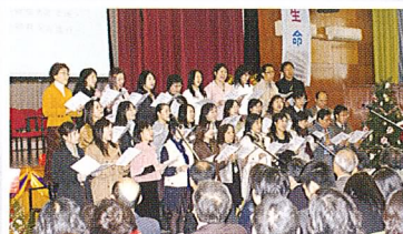
教師獻唱《向高處行》，帶領整個崇拜進入高潮。