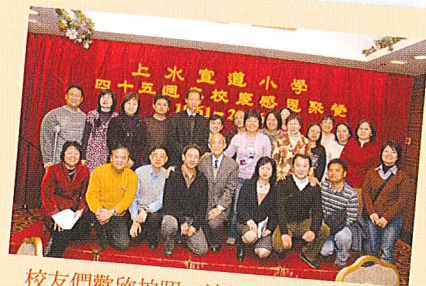
校友們歡欣拍照,連第一屆的校友也撥冗來臨,多熱鬧!