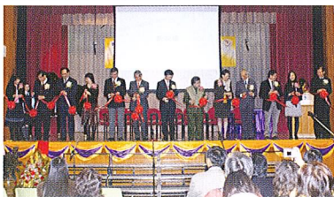
嘉賓為45周年校慶剪綵。