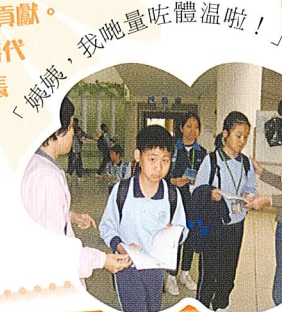
「姨姨，我哋量咗體溫啦！」

今年上水宣道小學四十五週年校慶，學校有今天的成績，實有賴學校全體教職員多年來的努力和貢獻。辦一間學校並非一件容易的事，隨著時代的進步，教育工作變得繁重。作為家長也希望自己的子女，能在一個充滿歡樂笑聲的校園裏生活。所以，我會努力盡量協助老師，共同創造優質的學習環境，使學生們愉快地學習和成長。