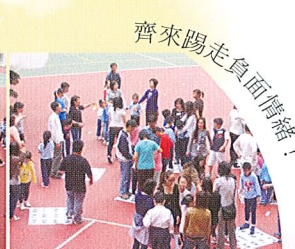
齊來踢走負面情緒！