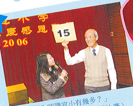
「你認識宣小有幾多?」 (15/16, 宣小歷史事件問答比賽)