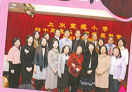
家長教師委員會大合照。