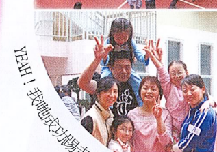
我哋玩緊「歡樂龍運可」，真刺激！