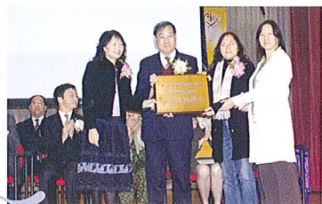
「萬錦星電腦室」命名捐款人致送紀念牌匾，校董及校長代表接受。