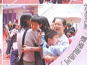
「歡樂龍運可」，真刺激！