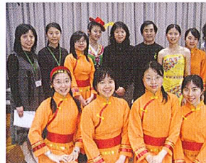
中國舞蹈團的演出很精彩呢