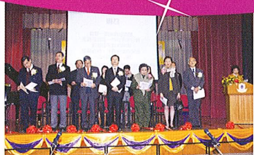
嘉賓蒞臨，崇拜正式開始。

不經不覺，宜小在神的帶領下，已踏入第四十五個年頭，為了感謝神對我們的眷顧，本校在去年十二月十六日舉行了四十五周年校慶崇拜。當日承蒙香港教育學院教務長蘇國生博士蒞臨，並擔任主禮嘉賓，為崇拜展開序幕。宜小師生、家長齊集在寬敞的禮堂，同聲頌唱，一起感謝神恩！