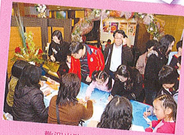
歡迎光臨校慶晚宴！