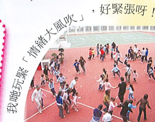
「情緒大風吹」，好緊張呀！