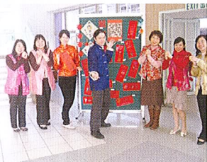
親愛的學生們，齊來認識中華文化吧!