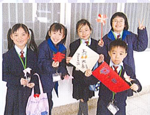
看! 我們學習了不少傳統的藝術!