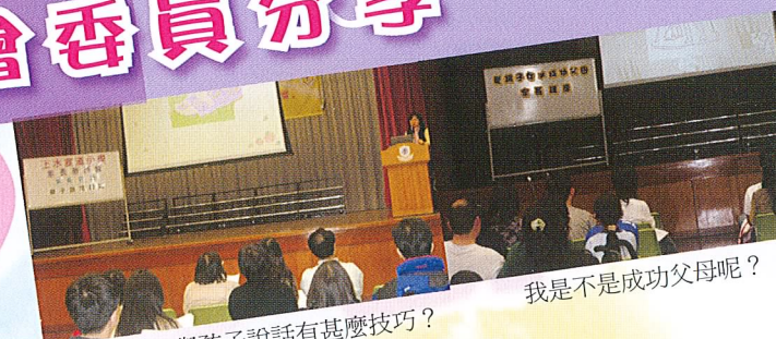
與孩子說話有甚麼技巧？

在校慶聚餐中，我感受到校長、老師和校友們的勞苦，他們不是專業的宴會「搵手」，單憑著一顆熱誠的心去做。另外，參與籌備工作帶動我對宣小的投入，亦加強孩子對學校的歸屬感—「家長多一份投入，孩子多一份愛宣小」是我今次最大的體會。