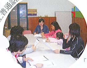
上普通話課真有趣！

每年「家長教師會」都會舉辦很多活動，例如：家長講座、親子旅行、家長興趣班等等，而這些活動能夠順利進行，實在有賴各位家長的支持。最後請各位家長繼續支持「家長教師會」，使我們的會務蒸蒸日上吧！