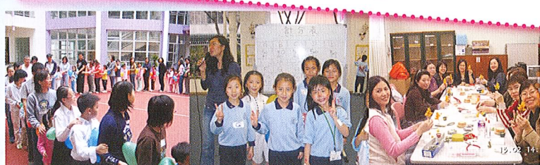
開心列車開動了！你上咗車未呀！