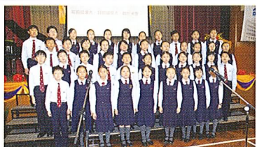
詩班為神獻唱美妙的歌聲。