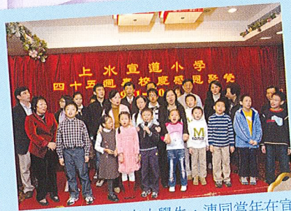
兩代校友(現在的宣小學生,連同當年在宣小畢業的爸爸媽媽)一起拍照,多溫馨!